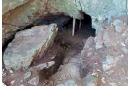
東側坑口完掘状況斜め上から