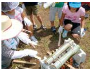
竹を使ってご飯を炊こう