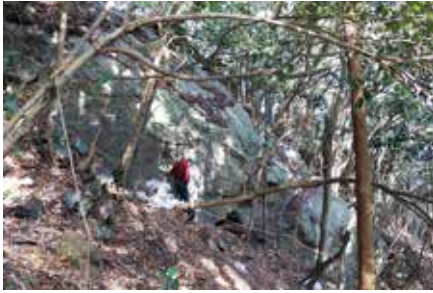
採掘坑南側からの遠景