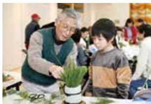
門松の作り方を教える

竹の産地・福井町は、かつてはタケノコの出荷や竹ぼうきの製造が町の主要な産業であった。しかし、少子高齢化や人口の都市部への流出などで竹産業に従事する人も少なくなつた。悠遊会の皆さんは、竹の産地ならではの技術や文化の一端でもこれからの若い世代に伝えたいと、