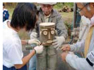
地元の子ともと竹人形づくり

催しでは、少しでも竹や地元で採れたものに触れてもらおうよう工夫を凝らす。「竹でご飯を炊こう」では、竹を飯ごうに見立てて、ブロックを組んだかまどで米を炊く。炊いたご飯を食する器も竹を割って作った。子どもは竹でご飯が炊けることにびっくりしているようです。また、年末の「ミニ門松作り」は、孟宗竹や大名竹、町の山で採った松やセンリョウなどで門松を作る。ほかにも、竹で人形を作ったり、竹炭で花瓶を作ったりと竹の技術・文化を楽しく交流しながら継承している。交流の環は町内にとどまらず「阿南市こども会」へと広がっている。