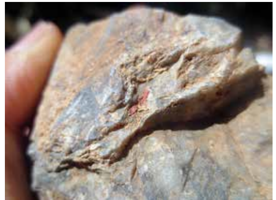
坑口から出土した辰砂