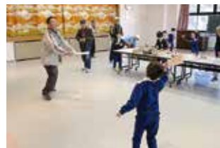
羽子板など昔の遊びで交流