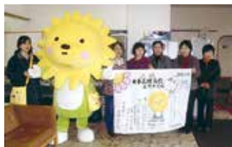
手作りの横断幕で野球部を迎える

そのほか、AMA（阿南市・室戸市・安芸市）文化交流事業参加やJAAグリアなんスタジアムでの県外高校野球部合宿のおもてなし、県南部健康運動公園内テニスコート完成記念式典でのベル演奏など、まちのイベントに花を添え、桑野地域に欠かせない存在となっている。