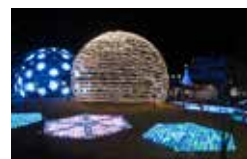
ANAN Luminous Town Project 2016 X'mas で展示

平成28年度コミュニティ助成事業(一般コミュニティ助成事業)により、かざぐるま実行委員会が、竹球体オブジェ用LEDを購入しました。