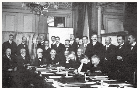
第1回ソルベイ会議(1911年)

市民の皆さまは、大湯新浜工業団地に立地している阿南化成株式会社をご存じでしょうか。この会社は平成元(1989)年1月に操業を開始したベルギーに本社を置くグローバル総合化学メーカー「ソルベイ」のグループ会社です。「ソルベイ」は、1863年にエルネスト・ソルベイ卿が設立し、現在、世界53カ国、145工場、21研究開発拠点、従業員約3万人を抱える大企業です。150年以上の歴史をもつ名門グループで、阿南工場では、レア・アースを主体とした、自動車排ガス浄化用触媒の材料を世界に供給しています。この阿南化成株式会社が本年1月1日をもって、社名を「ソルベイ・スペシャルケム・ジャパン株式会社」に変更し、名実共に世界的名称を冠する企業となりました。本市には日亜化学工業株式会社をはじめ、多くの優良な企業が立地しています。今回、「ソルベイ・スペシャルケム・ジャパン株式会社」に加わっていたルケム・ジャパン株式会社」に、世界的にも阿南市の知名度が上がった、いきものと確信しています。