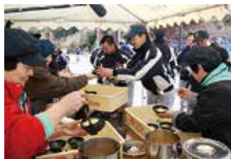
合宿で訪れた野球部に豚汁でおもてなし