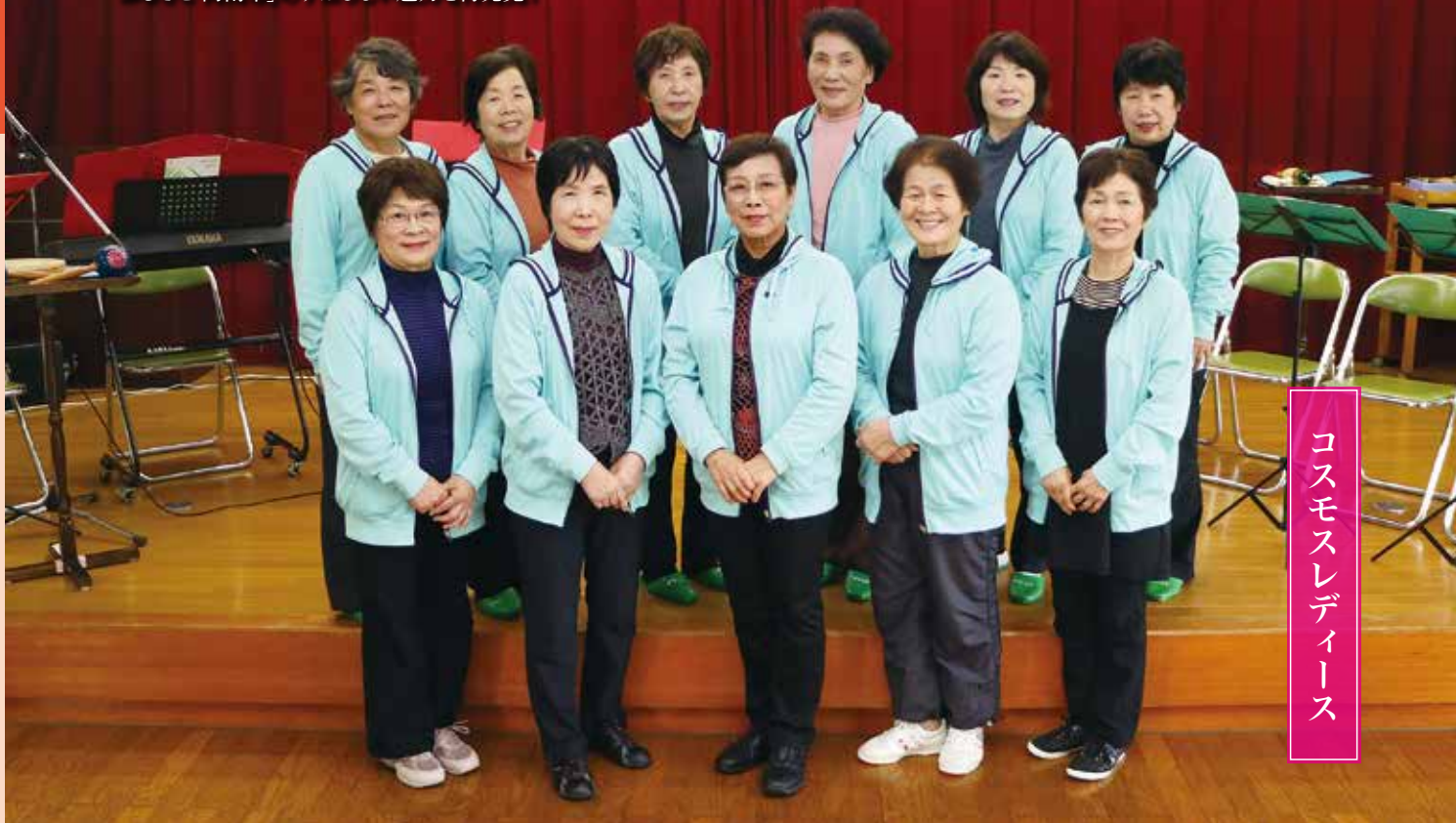
コスモスレディーズ

愛着ある桑野地域を「音楽のある明るい町にしたい」。そんな思いを胸に、音楽好きな主婦たちが合奏サークル「コスモスレディーズ」を結成した。平成元年4月から約30年にわたり、コンサートやイベント参加、慰問、また歩道の美化活動をするなど、地域に密着した活動を続けてきた。訪問先で披露するのは、歌、演奏、劇など、レパートリーは多岐にわたる。扱う楽器も、キーボード、バイオリン、ドラム、ギターなど幅広いのが特徴だ。