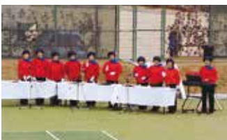
透き通ったベルの音色で式典を彩る