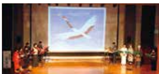
阿南町で「つるの恩返し」を披露

数ある活動の中で、平成24年11月、阿南町（長野県）への訪問が印象深い。阿南市と同町の交流20周年を記念して企画されたもので、市長を団長とする訪問団として参加。現地の交流イベントでは、大型スクリーンに映像を映し出して語り部とBGMで物語を奏でる創作民話「つるの恩返し」を披露した。声で表現した繊細な効果音と楽器の音色に乗せて民話を語る演出は、会場に詰めかけた来場者の胸を打った。さらに、フィナーレの創作阿波踊りで会場全体を感動の渦に包み込んだ。