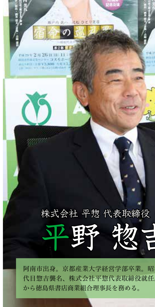
株式会社 平惣 代表取締役

※当日券は200円増し (前売り券完売の場合、当日券は販売しません) ※未就学児の入場はご遠慮ください。 チケット販売場所 情報文化センター 問い合わせは 情報文化センター (☎44-5000) へ