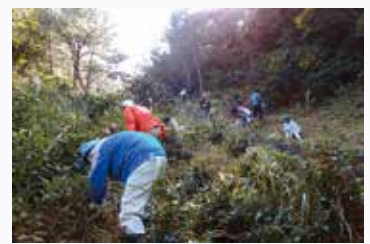
伊島ササユリ保護活動のようす

本フォーラムでは、伊島ササユリ保全活動や先進地事例をご講演していただき、また、伊島をモデルにその豊かな自然の保全・活用について協議することで、本市の生物多様性の保全と活用を促進し、地域活性化につなげることを目的としています。