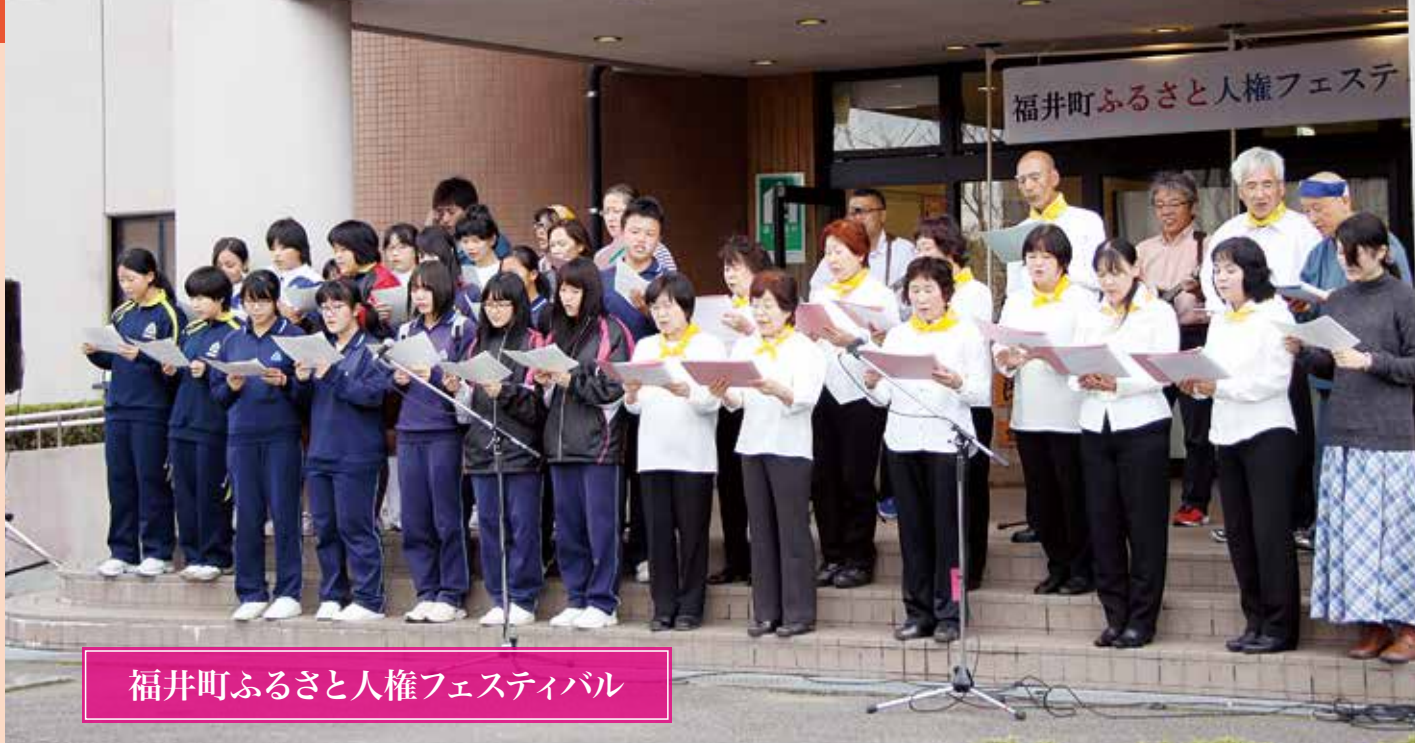
福井町ふるさと人権フェスティバル

「人権を大切にし、共に助け合うふるさと福井」をテーマに、「福井町ふるさと人権フェスティバル」が毎年10月下旬に福井町総合センターで開催されている。町民が集い、人権について一緒に考え交流する催しで、毎回多数の人でにぎわい、昨年の開催で18回目を迎えた。