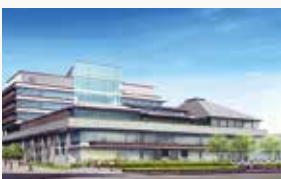
新庁舎完成予想図