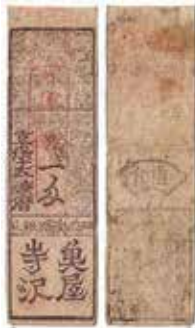
藩札に印刷された魚屋・寺沢の文字