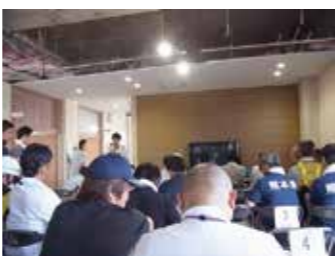
調査出発前ミーティングの様子

私たちの調査は、内閣府の定める認定基準を基に益城町で決められた独自の判断基準にのっとって家屋被害の程度を「全壊」、「大規模半壊」、「半壊」、「一部損壊」、「損害なし」に分類していくことである。しかし、土地勘の無い支援者だけでは被災の跡が色濃く残る地域で調査地まで向かうのは困難であった。そこで益城町では、益城町民の方がボランティアとして、支援者を現場まで案内し調査の手伝いまでしていただける仕組みが出来上がっていた。本調査業務では、町職員や町民ボランティア、支援者のそれぞれの役割がはっきり決まっていた支援活動が円滑に進められている。被災地では、当然ではあるが町職員を含め益城町に住むすべての人が被災者であり、その中でボランティア・支援者が復興のために尽力するためには被災者の協力がなくてはならないということ、私は支援活動を通じて知った。