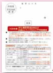
▲がん検診の受診券です