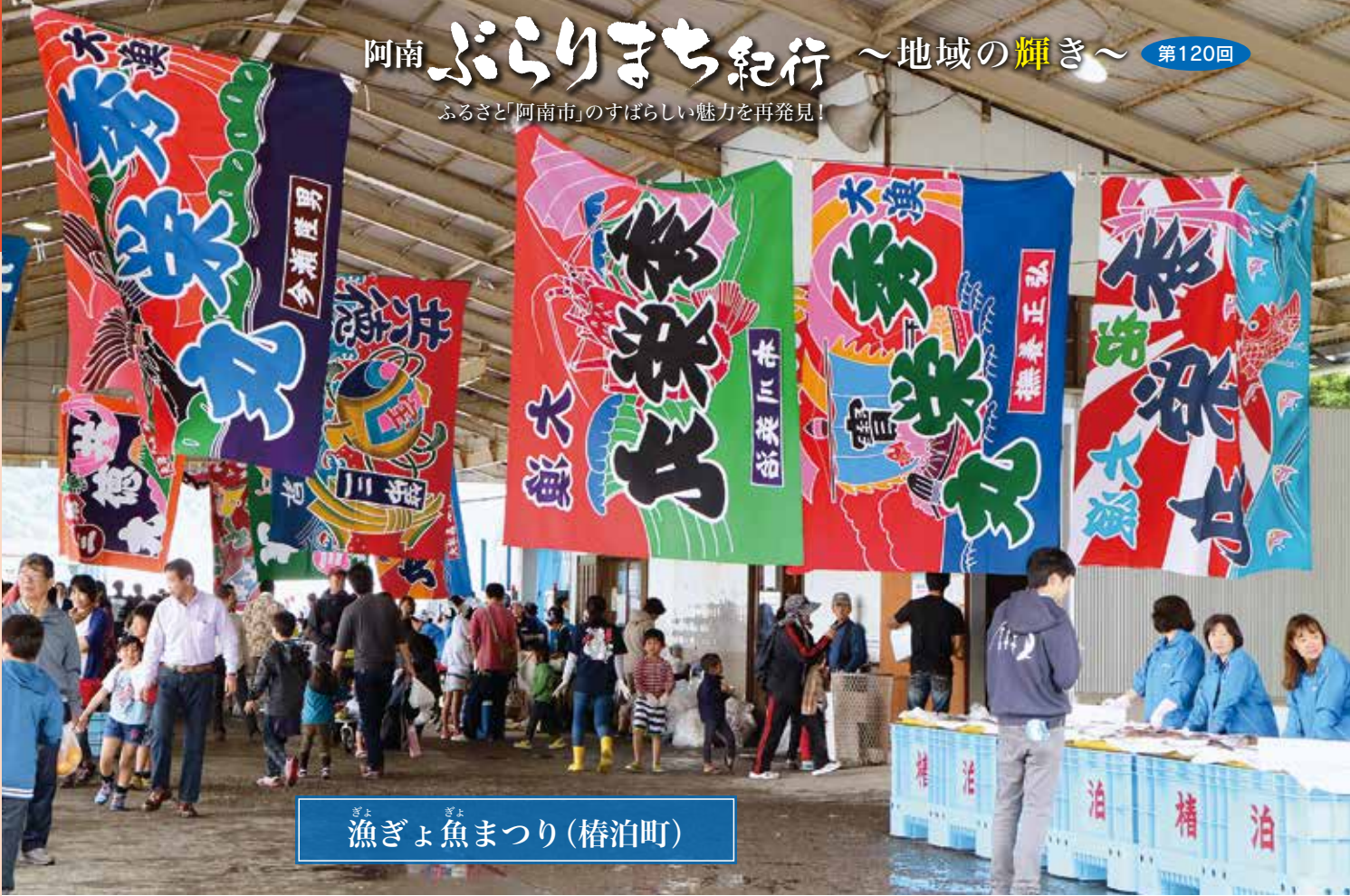
漁ぎょ魚まつり(椿泊町)