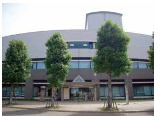
施設名：阿南市情報文化センター 所在地：羽ノ浦町中庄上ナカレ16番地3