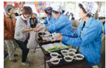
地元わかめ入りのみそ汁が配られた

極彩色の大漁旗が飾られた会場には、開始前から大勢の親子連れなどが詰めかけ、活魚の即売や海の生き物と触れ合える「鮮魚のつかみどり」、「タッチングプール」など多彩な催しを楽しんだ。「いけすコーナー」では、鯛やハマチ、イセエビ、骨切りされたハモ、とれたての生しらすが浜値で販売され、訪れた人々は漁協関係者から料理方法を聞いたりして、お目当ての魚などを買い求めた。