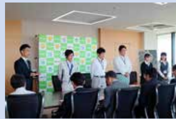
阿南市職員出発式の様子

熊本、大分両県の地震被害で、本市では「阿南市地震被災地支援対策本部」を設置し対応にあたっています。被災地支援活動では、関西広域連合徳島県支援チームの一員として熊本県上益城郡益城町で避難所運営や家屋被害認定、健康相談などに従事し、それぞれ3日から5日間現地で支援活動を行っています。支援活動に従事した職員に被災地で感じたこと学んだことを綴ってもらいました。