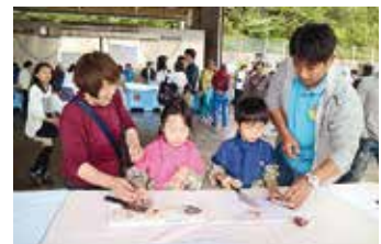
「魚っSUN's」による魚料理教室

また、漁協女性部からは天然わかめのみそ汁が振る舞われ、来場者は風味豊かな海の幸に舌鼓を打った。その他、地元小学校や商店、セニアクラブなど地域が一体となったおもてなしに来場者は港まちの雰囲気を感じているようす。今年新たな試みとして、魚食普及活動に取り組んでいる椿地区青年漁業者グループ「魚っSUN's (うおっさんず)」による親子魚料理教室が開催され、参加者は慣れない手つきながら、熱心に魚の調理に取り組んだ。