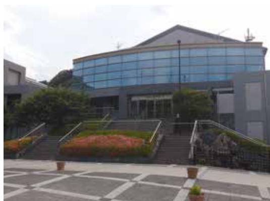
施設名：阿南市文化会館 所在地：富岡町西池田135番地1