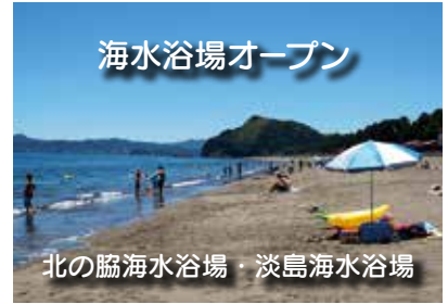
北の脇海水浴場・淡島海水浴場

※会場周辺で、小型無人機「ドローン」等の飛行は自粛してください。 ☎ 商工観光労政課 (☎22-3290) へ