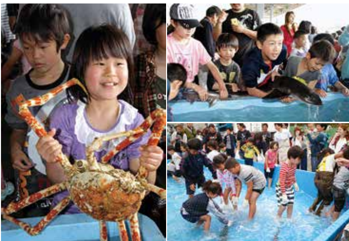
“海の生き物とふれあう” 鮮魚のつかみどりやタッチングプール

昨今の漁業を取り巻く環境は、水産物の消費低迷や水産資源の減少、長期間にわたる燃油の高騰、後継者不足などで厳しくなっている。この閉塞した状況を打開しようとする港まち椿泊町で、魚に親しむイベントが開催されている。その名も、「漁ぎょ魚まつり」。ハモやタチウオをはじめ魚種が豊富で水揚げ高が県下一の椿泊漁業協同組合が、新鮮な海の幸をPRしようと椿泊漁協の荷捌き場で開催し、毎年好評をほくし今回で5回目となった。