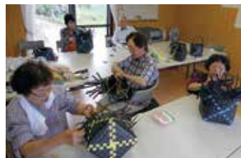
荷造り紐の籠づくり真剣に取り組む

夏には、スイカ割りやメダカすくい、シャボン玉、ピングゲームなどを催し、親・子・孫の三世代が交流する。子どもたちにとっては遊びのビックリ箱。嬉々として湧き上がる歓声や子どもたちの目の輝きが、メンバーの喜びであり励みとなる。ほかに、籠づくりや写経、また、秋には近隣の広重地区と合同で健康教室を行い、健康づくりにも取り組んでいる。会の結成から5年目となる今も、自分たちで考え楽しみながら活動を続けている。