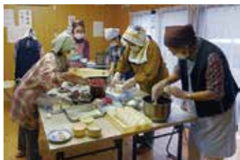
早朝よりお接待のおにぎりを手作りする

春には、歩き遍路さんのための接待所を設け、真心込めて作ったおにぎりやかしわ餅、みかんなどでお接待をする。豊かな自然の中、全国各地、外国の人々とあたたかな触れ合いが生まれる。