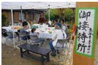
今春は5月3日に、第23 番札所薬王寺までの遍路道に接待所を設ける