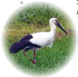
コウノトリは約3週間滞在したという

平成26年5月、生谷に国の天然記念物のコウノトリが飛来した。「この地に何十年と住んでいるが、コウノトリを見たのは初めて」と話す皆さん。幸せを運ぶ鳥は、生谷の熱い思いに応えるためここに立ち寄ったに違いない。