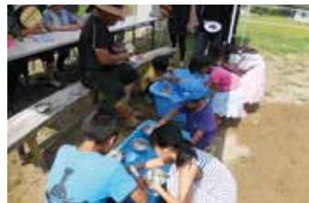
三世代の交流は何よりの元気の源