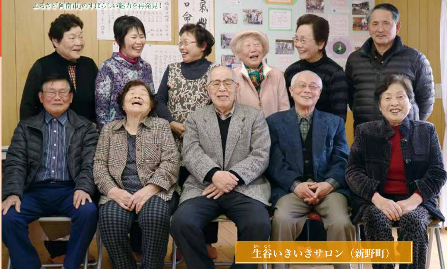
おいだに 生谷いきいきサロン (新野町)

今、こんな自然体で笑えますか。 超高齢化社会を迎えようとしている中、高齢者が住み慣れた土地で親しい友人に囲まれ、いきいきと暮らしていける。そんなあつたかい居場所「生谷いきいきサロン」がある。