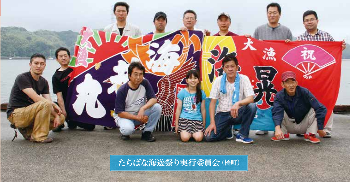
たちばな海遊祭り実行委員会 (橋町)

港まち、橋町で夏の恒例行事になっている「たちばな海遊祭り」。17年前に町の有志が、地元の魅力を知ってほしい、また夏の思い出づくりの場にしてほしいと始めた。祭りは、漁師町の特徴を生かした催しを行っている。獲れたての鮮魚のつかみ取りや、阿波の松島と称される橋湾を漁船で周遊するクルーズなどで、来場者は、海の恵みを体いっぱいと感じることができる。