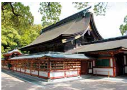
太宰府天満宮 本殿