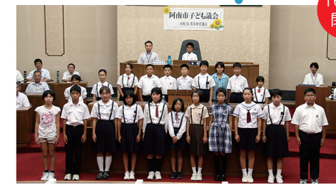
最後にみんなで記念撮影。お疲れ様でした。