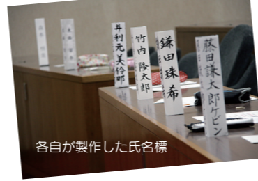
各自が製作した氏名標