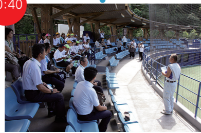
JAアグリあなんスタジアムを視察