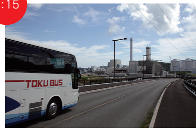
市内施設の視察。まずは橘町小勝へGO!