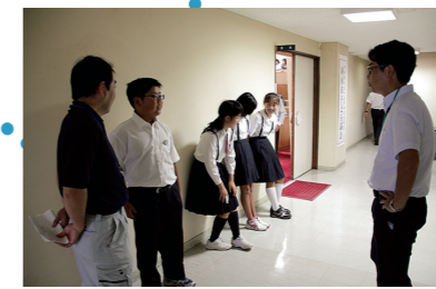
休憩時間にひと息つくようす