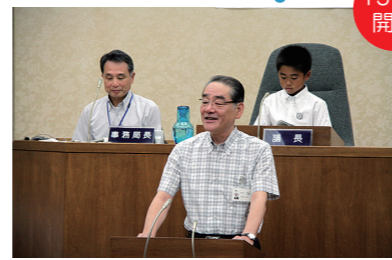
「リラックスして質問してください」と あいさつする岩浅市長