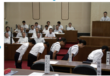
議場での立ち振る舞いを学んだ子ども議員