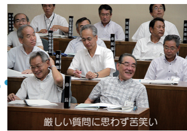
厳しい質問に思わず苦笑い