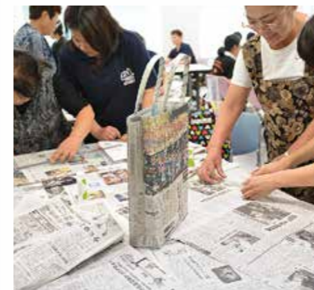
徳島新聞販売店協同組合「みつわ会」の皆さんの指導で、ボランティアスタッフが新聞エコバッグの試作をしました。参加者の資料袋に使用します。(8月18日)