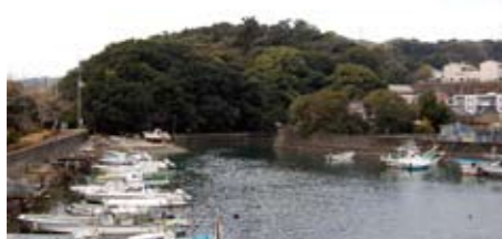
海正八幡神社の社叢

この社叢は昭和六十三年度環境庁巨樹・巨木林フオーアップにより六本が測定され、それぞれ幹周り三〇〇センチ以上、推定樹齢二〇〇年以上と考えられている。参考のため六本の幹周りを紹介しよう。