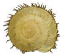
ヒラオオケマイマイ