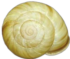
セトウチマイマイ