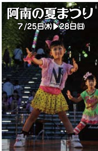
阿南の夏まつり 7/25日(木)▶28日(日)