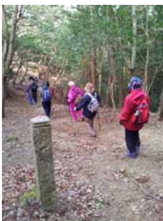
「かも道」を歩くようす

「かも道」を歩くようす また、「かも道」や遍路道沿いの文化財を写真などで紹介した遍路道マップ(阿南市・勝浦町)を阿南市文化会館にて配布しています。ぜひ、ご利用ください。