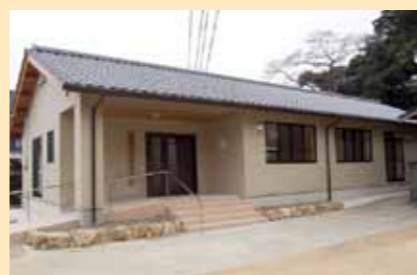
問い合わせは ふるさと振興課(☎22-7404)へ

明谷自治協議会は、(財)自治総合センターの宝くじ受託事業収入を財源とした「平成24年度コミュニティセンター助成事業」から助成を受け、明谷コミュニティセンターを建設しました。今後、地域のコミュニティ活動の振興・発展の場として、大いに活用されることを期待します。