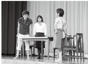
海部高校文化祭公演風景

海部高校は創立9年目の新しい学校です。演劇部も本格的に活動を始めてまだ4年目ですが、観客の皆さまに「熱」を届けられる舞台をめざし練習をしています。