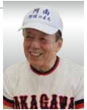
映画「モンゴル野球青春記」 上映実行委員会会長