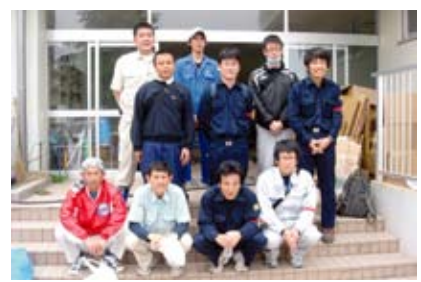
関西広域連合宮城チーム（第11次）として 気仙沼市大島に派遣された8人と現地職員

宮城県北部沿岸市町支援本部への派遣として従事したのは5月27日から6月5日まででした。帰県してからの1カ月後（7月5日）には、阿南市でも和歌山県北部を震源とするマグニチュード5・4の地震がありました。阿南市は震度4でしたが、これは阪神淡路大震災の時と同じ震度だったと記憶しています。（揺れの長さは違ったと思います。3月11日の大地震以降、全国各地で頻りに強い揺れの地震が起こっており、私自身被災地を目の当たりにしてきたにもかかわらず、未だに非常用持出袋一つの用意もできていません。頭の中では常に危機感を持って考えてはいるつもりですが、たったこれだけのことができないのです。わかっているにもかかわらず行動に移せないのが人間だとは思いますが、最低、非常用持出袋の準備といざ地震が起きた場合は携帯電話が繋がらない状態になることが予想されるので、家族間で避難場所を決めておくなど自分たちでできることは後悔のないようにしておこうと、この文を書きながら改めて思っています。より多くの方が、この準備だけでもしていれば助かる命もあり、少しでも被害を食い止めることができると思います。津波で役場が流されては行政機能もストップしてしまいます。支援物資が届くのに何日かは掛かってしまいます。地震発生後の自分の身は自分で守らなければならぬと強く感じました。「備えあれば 憂いなし」です。