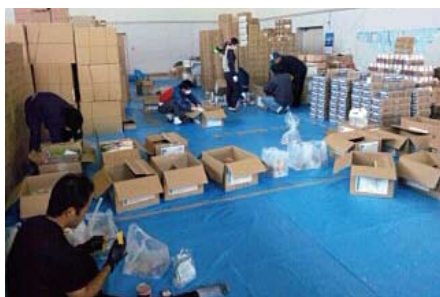
支援物資を仕分けるようす。(大島開発総合センター)