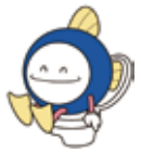
9月10日は「下水道の日」

排水設備工事は必ず指定工事店で 宅内の排水設備を下水道へ接続するための排水設備工事は、「阿南市排水設備指定工事店」でなければ行うことができません。排水設備工事を行うときは、必ず指定工事店に依頼してください。