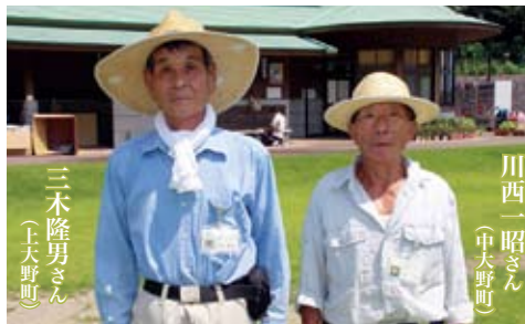
※管理人は6人います。