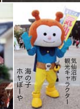
気仙沼市 観光キャラクター 海の子 ホヤぼーや