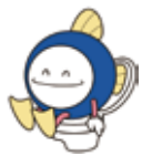
9月10日は「下水道の日」

排水設備工事は必ず指定工事店で 宅内の排水設備を下水道へ接続するための排水設備工事は、「阿南市排水設備指定工事店」でなければ行うことができません。排水設備工事を行うときは、必ず指定工事店に依頼してください。