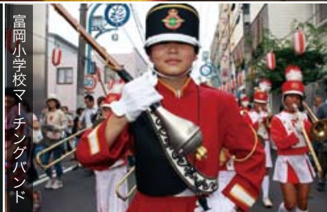
富岡小学校マーチングバンド