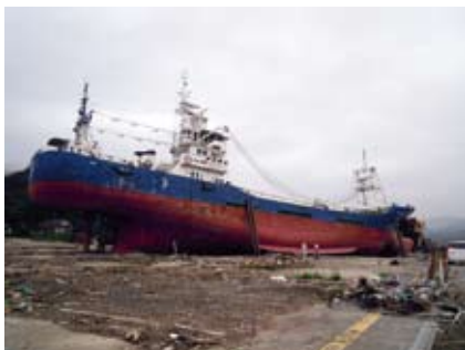
陸に打ち上げられた330トンの巻き網漁船。気仙沼市ではこの船舶を永久保存し、この一帯を大震災の復興記念公園にする計画もあるようです。

釜石東中学校（生徒数222人）の生徒たちは、地震発生後、教師の指示を待たず、教室を飛び出し高台に向かって走り出しました。