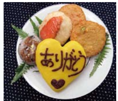
震災前に売り出した “ホワイトデーかまぼこ”

震災後、初めて見る閑上の光景に言葉を失う。自宅付近はがれきで埋もれ、建っていた場所がようやくわかるほどだった。工場は原形をとどめず、多額の費用を投じた製造設備や原料・資材はすべて流失していた。「まだ志半ば。たった一日にしてすべてが終ってしまうのか」。もつていきような悲しみと怒りが込