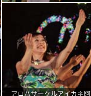
アロハサークルアイカネ阿