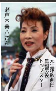
よちんこい「チーム舞人」