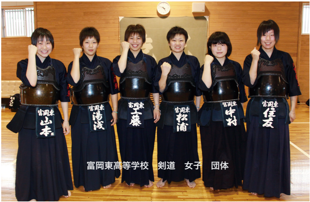
富岡東高等学校 剣道 女子 団体

これまで経験してきたことを生かしながらか、チャレンジ精神を忘れず、少しでも全国の舞台上で良い結果が残せるよう一杯頑張りたいと思います。