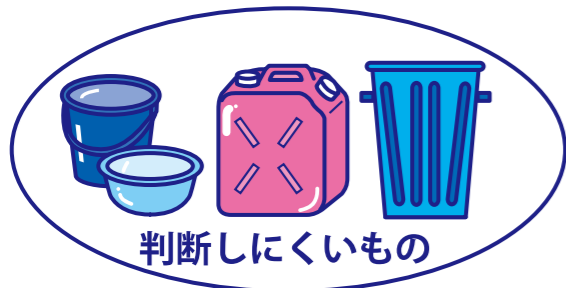
判断しにくいもの

ガラス、せともの、ガラスコップ等の割れものは、 新聞紙等で包み『危険』と表示 して出してください。