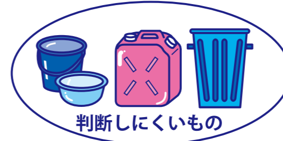
判断しにくいもの

ガラス、せともの、ガラスコップ等の 割れものは、新聞紙等で包み『危険』 と表示して出してください。